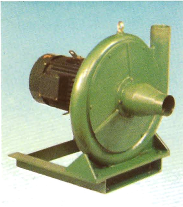
Ventilador Succionador de Afrecho