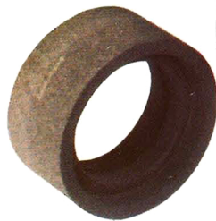
Cilindro de Cepillo de Acero