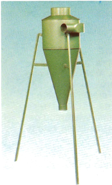
Ciclon Colector de Afrecho